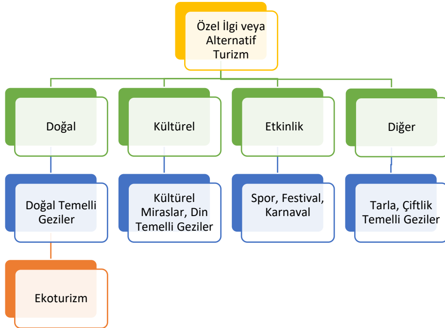
Şekil 2: Özel ilgi veya alternatif turizm çeşitleri

İnsanların, son yıllardaki tüketim alışkanlıklarında meydana gelen değişiklikler turizm sektörüne de yansımıştır. Doğa içinde kaliteli vakit geçirilen tatiller ilgi odağı olmuştur. Turist ve turizm alanındaki bu değişim alternatif turizm kavramını on plana çıkarmıştır. Alternatif turizm, turizm kaynaklarının giderek azalması ve tüketicilerin kitle turizmine olan ilgisinin azalmasıyla gelişmiştir (Şengöz, 2018). Son yıllarda on plana çıkan alternatif turizm çeşitleri Şekil 1’de gösterilmiştir.